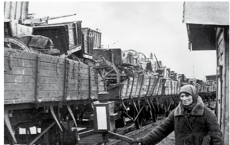
Вверху: Отправка добровольцев на фронт, Свердловск, 1941 год, Внизу: Эшелон с оборудованием эвакуированного завода движется на Урал.