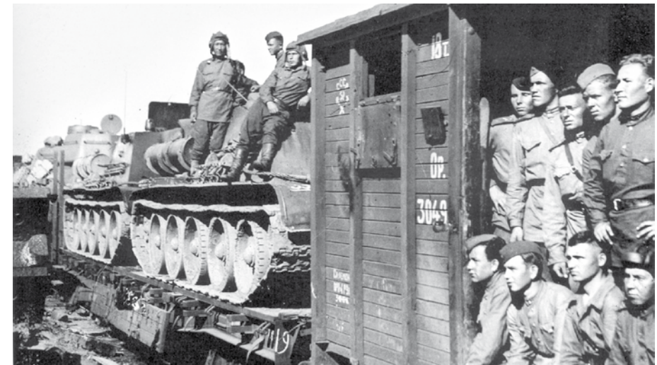
Эшелон с воинами и боевыми машинами Уральского добровольческого танкового корпуса, июнь 1943 года

В некоторых подразделениях разведки «чёрные нож» вручался новичкам только после взятия нескольких «языков» или других боевых испытаний.