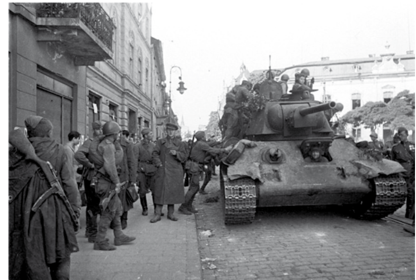
Вверху: Львовско-Сандомирская наступательная операция, июль 1944 года. Внизу: Советские танки на улице освобождённого Львова.