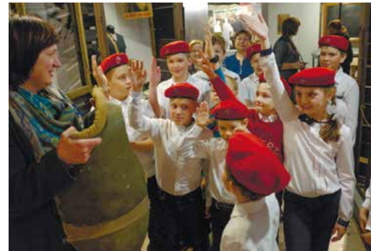
Школьная экскурсия в Пермском краеведческом музее, март 2019 года.

В течение учебного 2019-2020 года занятия будут проводиться в Центре истории УДТК и дополняться циклом культурно-массовых мероприятий, включающих экскурсии в музеи, на выставки, по местам трудовой славы уральцев.