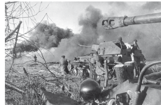
Вверху: Захваченная техника противника, 1945 год.