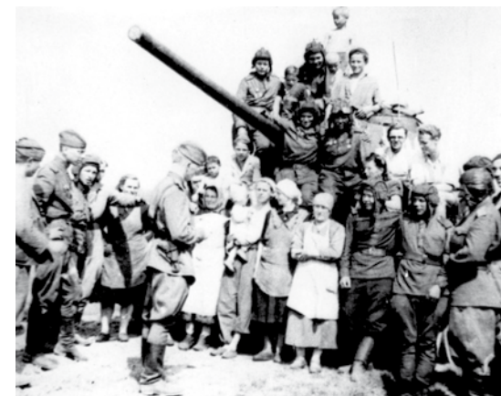
Вверху: Перевал через Рудные горы. Чехословакия, 1945 год. Внизу: Бойцы УДТК слушают сообщение о капитуляции Германии, 1945 год..