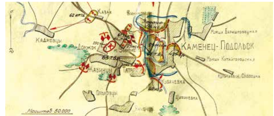
Вверху: Передислокация танков и пехоты на новый рубеж.