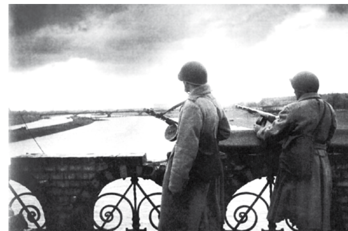
Вверху: Воспитанник УДТК и командир 4-й танковой армии Д.Д. Лелюшенко. Внизу: Советские автоматчики на мосту через Одер. Германия, 1945 год,