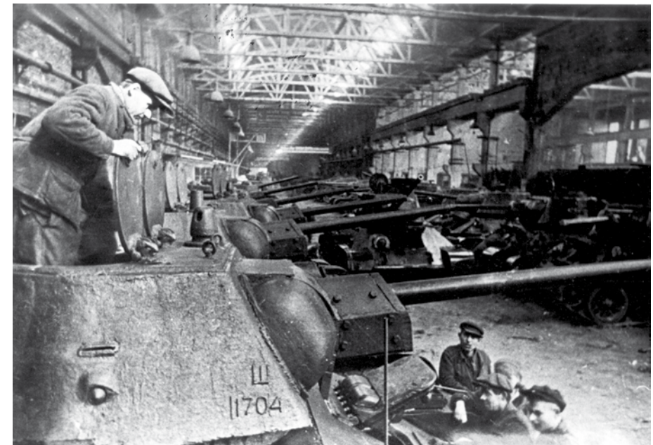
Цех сдачи танков на Уральском танковом заводе, Нижний Тагил, 1943 год

24 февраля Председатель Государственного Комитета обороны Иосиф Виссарионович Сталин ответил: «Ваше предложение о формировании Особого добровольческого Уральского танкового корпуса одобряется и приветствуется. Дано распоряжение Главному автобронетанковому управлению оказать вам помощь и подбор комсостава».