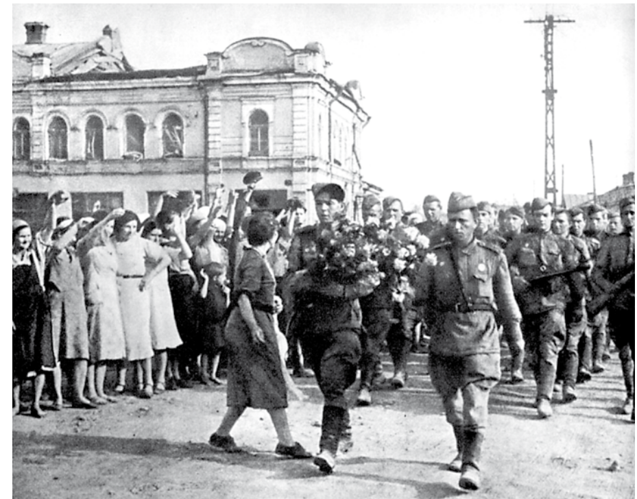
Вверху: Момент боя на Курско-Орловской дуге. Внизу: Жители освобождённого Орла приветствуют воинов Уральского добровольческого танкового корпуса, август 1943 года.