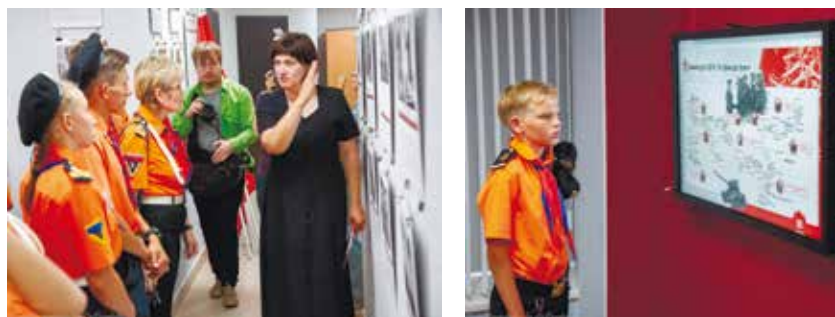
Воспитанники отряда «Каравелла» знакомятся с интерактивной экспозицией и выставками в Центре истории УДТК, 2019 год.

По каждому направлению патриотического воспитания могут быть достигнуты соответствующие воспитательные результаты. Достижение трёх уровней воспитательных результатов обеспечивает появление значимых эффектов патриотического развития и воспитания обучающихся. Таким образом, систематическая работа по патриотическому воспитанию позволяет создать условия для воспитания гражданственности, патриотизма, уважения к правам, свободам и обязанностям человека.