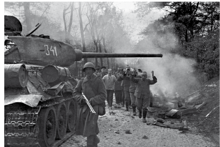
Вверху: Советский танкист у стен Рейхстага, май 1945 года. Внизу: Противник сдаётся!