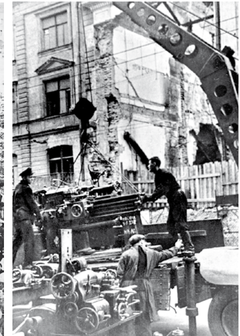
1. Свердловчане слушают сводку с фронта на Площади 1905 года, 1941 год. 2. Эвакуация завода под бомбёжкой. Харьков, 1941 год.

В Сарапуле слились воедино местная обувная фабрика и прибывшие из Харькова, Орла и Торжка родственные предприятия. Здесь же оформился производственный альянс Сарапульского лесозавода с Бобруйским лесокombинатом и Прилукской мебельной фабрикой.