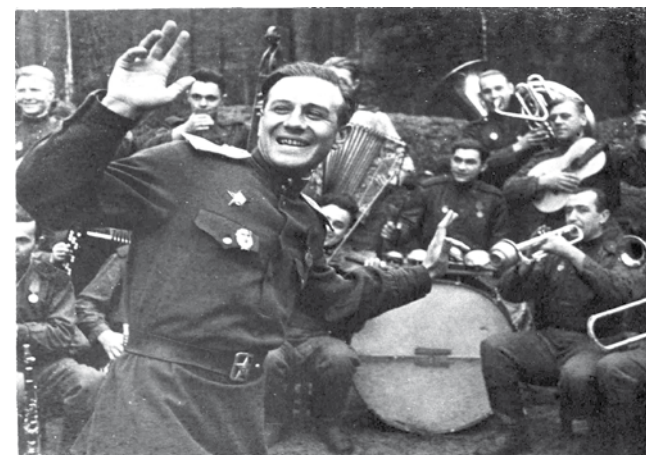
Вверху: Командующий 4-й танковой армией В.М. Баданов, командир корпуса Г.С. Родин у гвардейского знамени УДТК. Внизу: Джаз-оркестр УДТК.