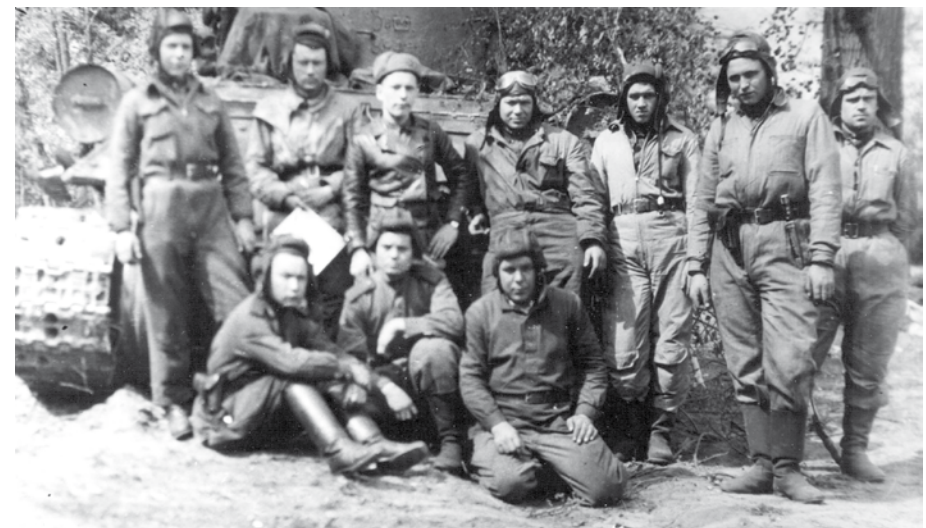
Вверху: Автоматчики 197-й Свердловской танковой бригады, июнь 1943-го. Внизу: Танкисты 61-й Свердловской танковой бригады, 1944 год.