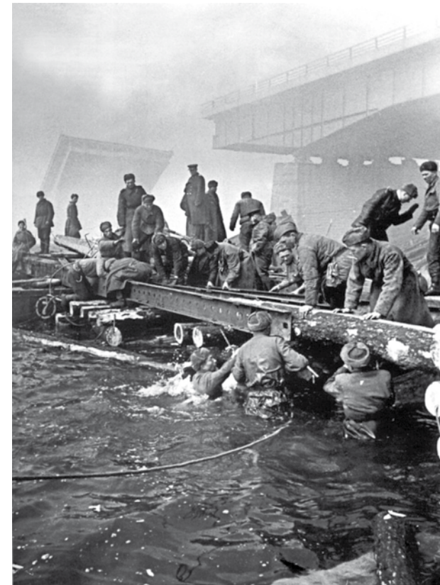
Сапёры наводят понтонную переправу через реку Одер, апрель 1945 года.

Тем временем Пермская танковая бригада принимала участие в уничтожении кельце-радомской группировки фашистских войск и содействовала освобождению города Кельце, крупного административного и хозяйственного центра Польши.