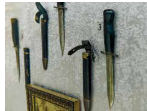
Чёрный нож для воинов УДТК в экспозиции Златоустовской Оружейной фабрики

Подразделение получило неофициальное наименование у противника «Schwarzmesser Panzer- Division» (танковая дивизия «Чёрные ножи»).