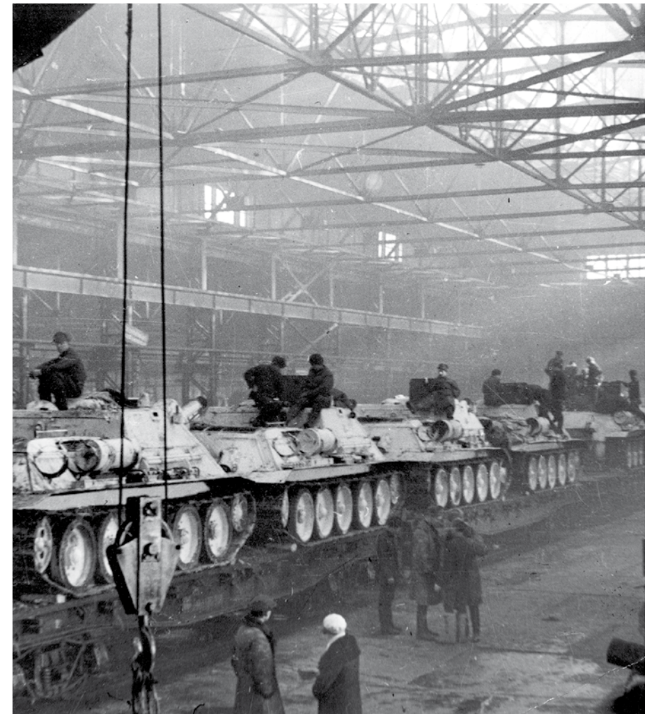
Производство САУ на Уралмашзаводе. Свердловск, 1943 год

Первоклассные машины ленинградцев и харьковчан, опыт массового производства уральцев создали необходимые предпосылки для быстрого выпуска танков. Всего за годы войны учёными и конструкторами было разработано около ста образцов боевых машин. Большая часть их выпускалась поточным производством. Уральцы первыми в мире поставили на поток производство танков.