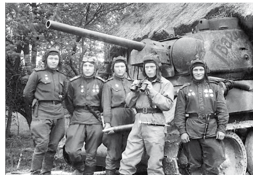
Вверху: Встреча ветеранов корпуса.