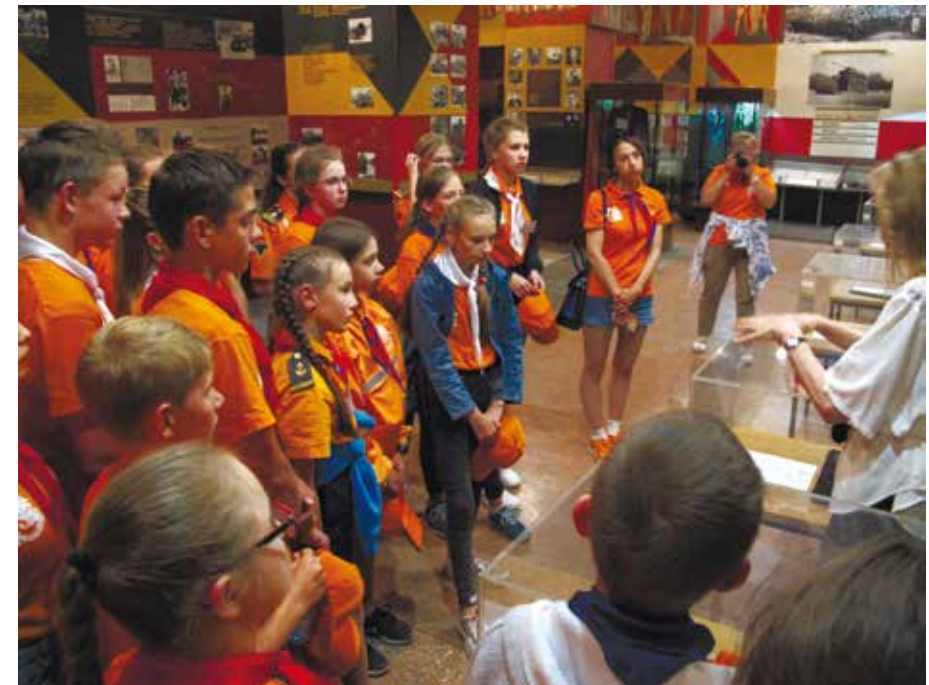
Музейный урок для отряда «Каравелла» в Музее боевой и трудовой славы Челябинского тракторного завода, июль 2019 года.